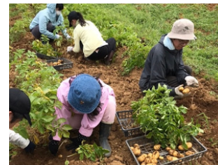
自社農園(ララファーム)