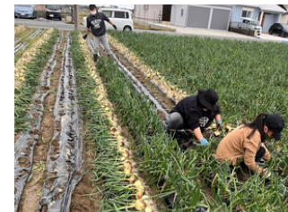
施設外(市内農園さん)